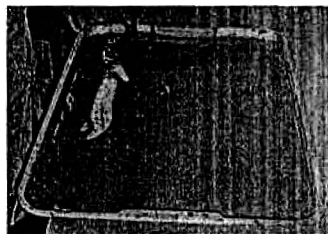
(3) เทส่วนผสมขึ้นบนซึ่งเป็นน้ำยางพอลิยูรีเทน