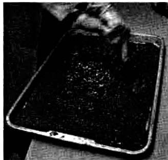
(2) เทลงบนถาดและเกลี่ยให้ได้ระดับ