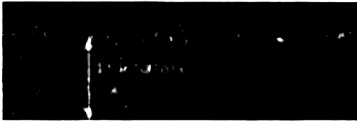
รูปที่ 2 ภาพตัดขวางของพื้นลู่วิ่งกรีฑา

ยางพอลิยูรีเทนอีกครั้ง ซึ่งการเคลือบผิวด้านบนสุดนี้จะไม่ส่งผลกระทบต่อลักษณะความหยาบของพื้นผิวแต่อย่างใด