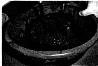
(1) ผสม isocyanate กับ Polyols และเม็ดยางดำ

ขั้นตอนนี้เป็น การเตรียมชิ้นตัวอย่างลู่-ลาน กรีทขนาด 30 x 60 เซนติเมตรโดยใช้อัตราส่วนพอลิ ยูรีเทน เม็ดยางดำ และเม็ดยางแดงสูตรต่างๆ ตลอดจน ใช้เทคนิคการเตรียมที่แตกต่างกันไป โดยขั้นตอนและ วิธีการเตรียมชิ้นตัวอย่างลู่-ลานกรีทได้แสดงในรูปที่ 4