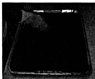
(4) โรยเม็ดยางแดง