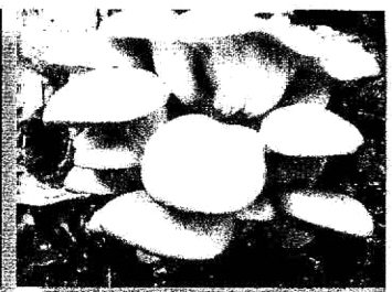
เห็ดนางรมดอย