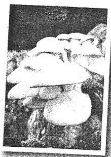
เห็ดนางรมคอดย

ความเป็นพิษเทียบพลาตินค้อมีผิวหนัง และไม่ก่อการแพ้ต่อผิวหนัง ทั้งนี้เซรั่มบำรุงผิวลดริ้วรอยเป็นผลิตภัณฑ์