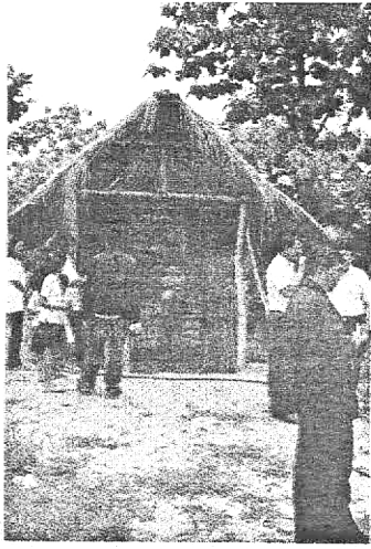
โรงเรียนสร้างไม่ยาก

ควรรเลี้ยงหมูไม่เกิน 3 ตัว เพื่อไม่ให้เกิดความแออัดในการเลี้ยงจนเกินไป